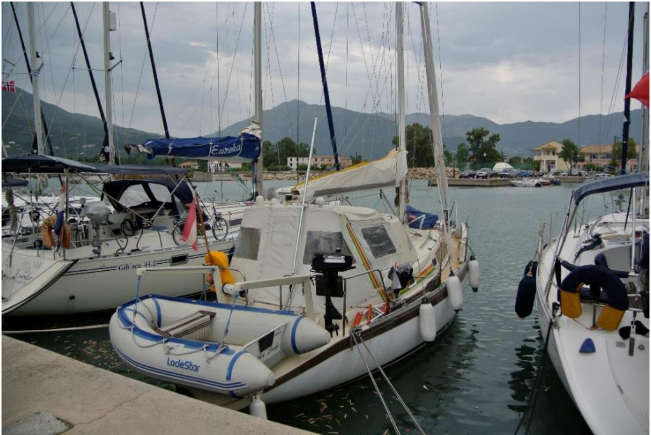
„Kuchenbude“ = wetterfestes Rundumverdeck beim Cockpit + altes (nicht mehr vorhandenes) Beiboot