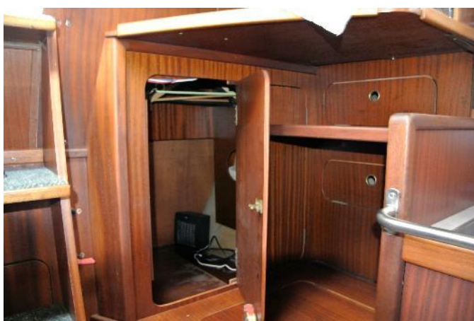
Großer Stauraum backbord