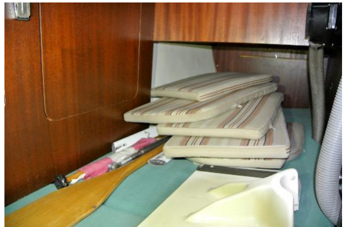
Hundekoje -steuerbord (mit gestreiften Sitzkissen)