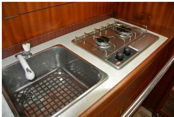
Abwasch und Gasherd