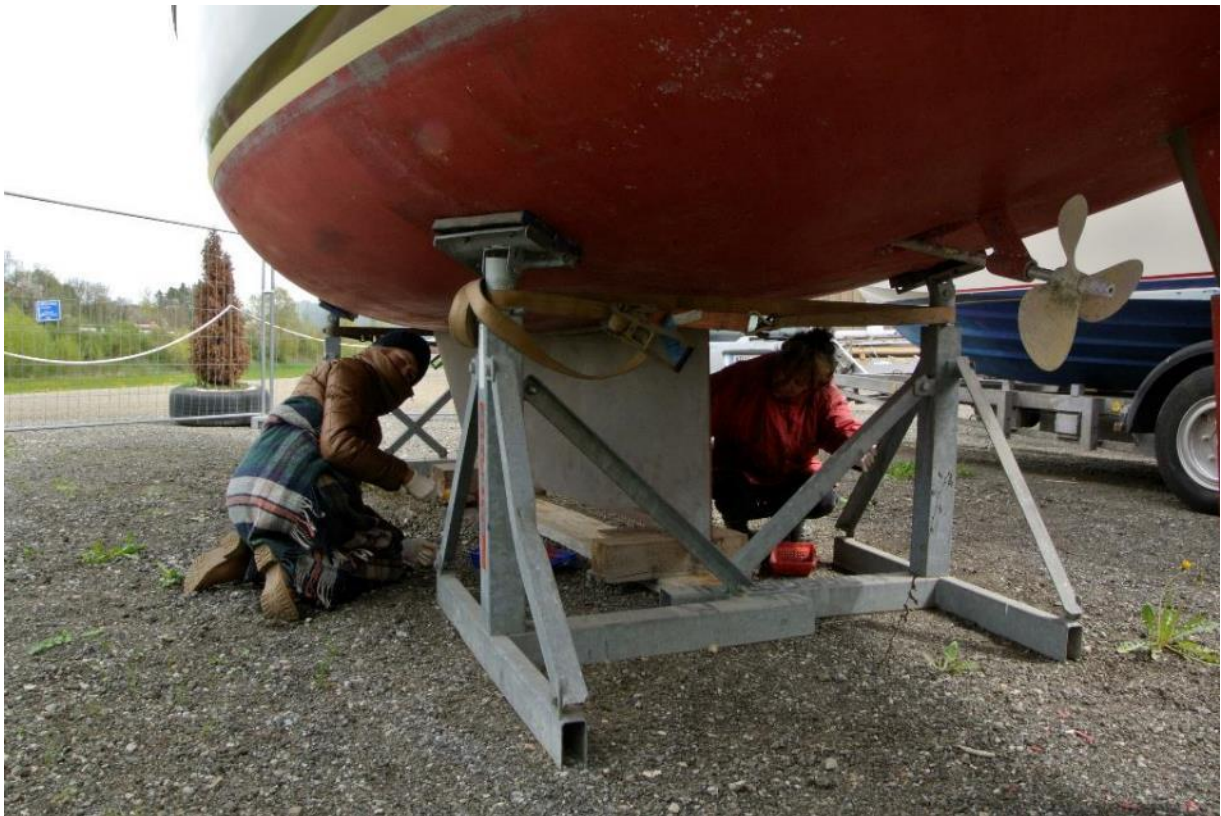
Jährlich neues Antifouling