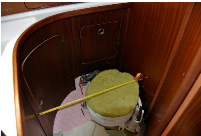
Sanitärraum, WC (neue Pumpe)