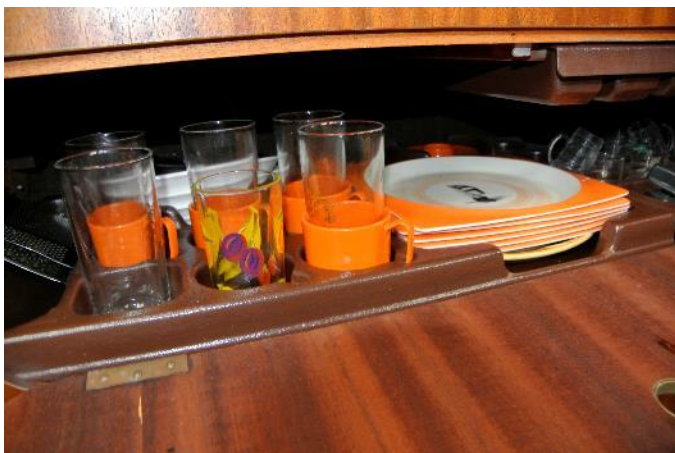
Stauraum unterhalb der Abwasch