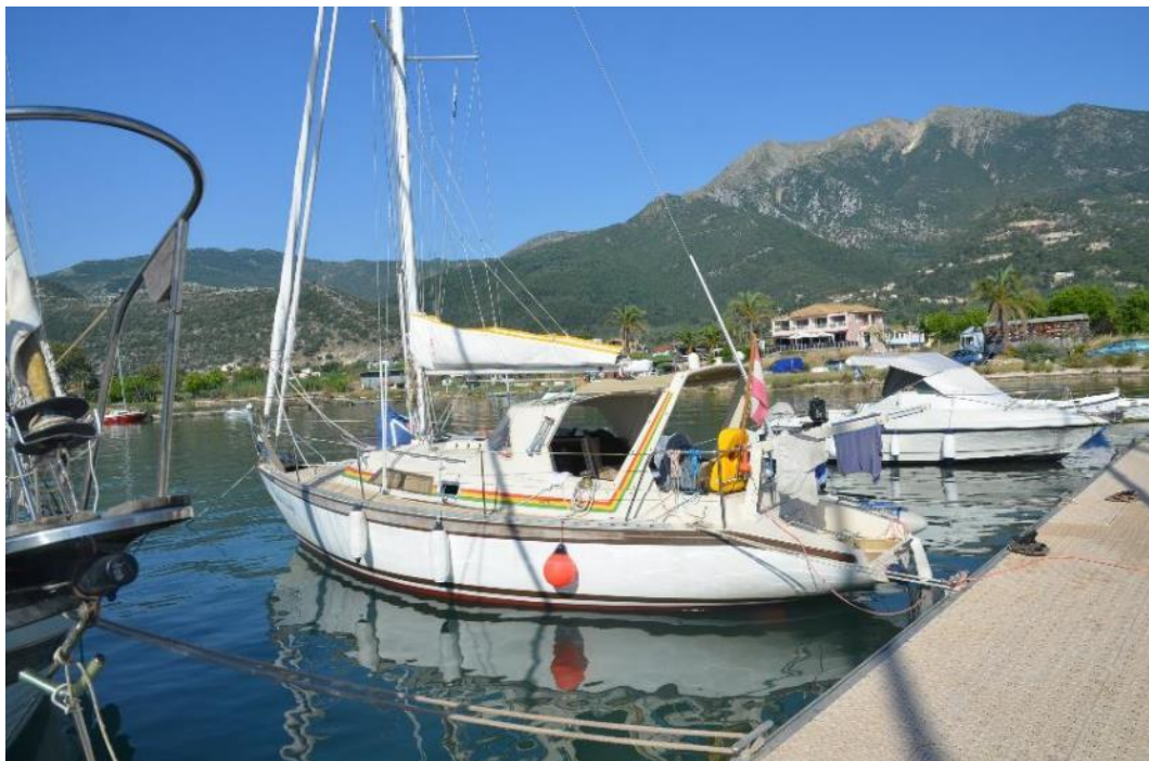
Mit kleinem Sonnendach