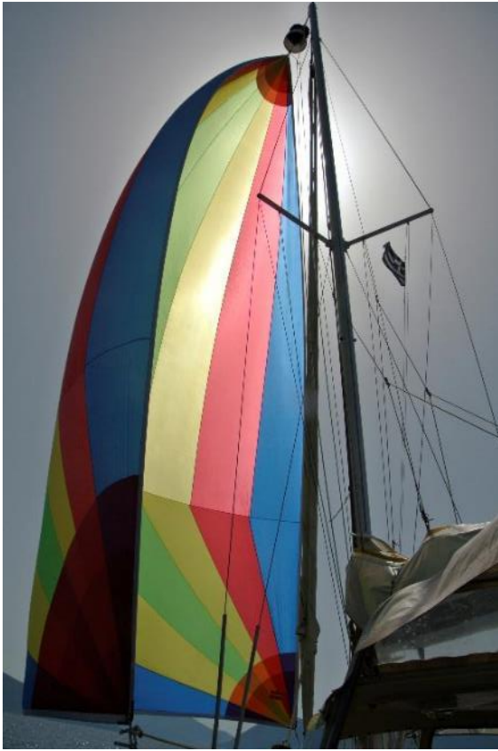
Blister mit Bergeschlauch