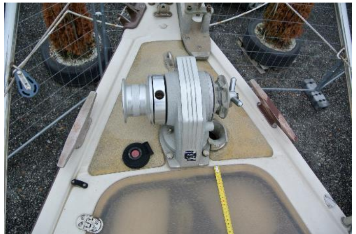
Elektrische Ankerwinch für das Einholen des Ankers, Anker setzen = manuell, bzw. mit „Seilfernbedienung“