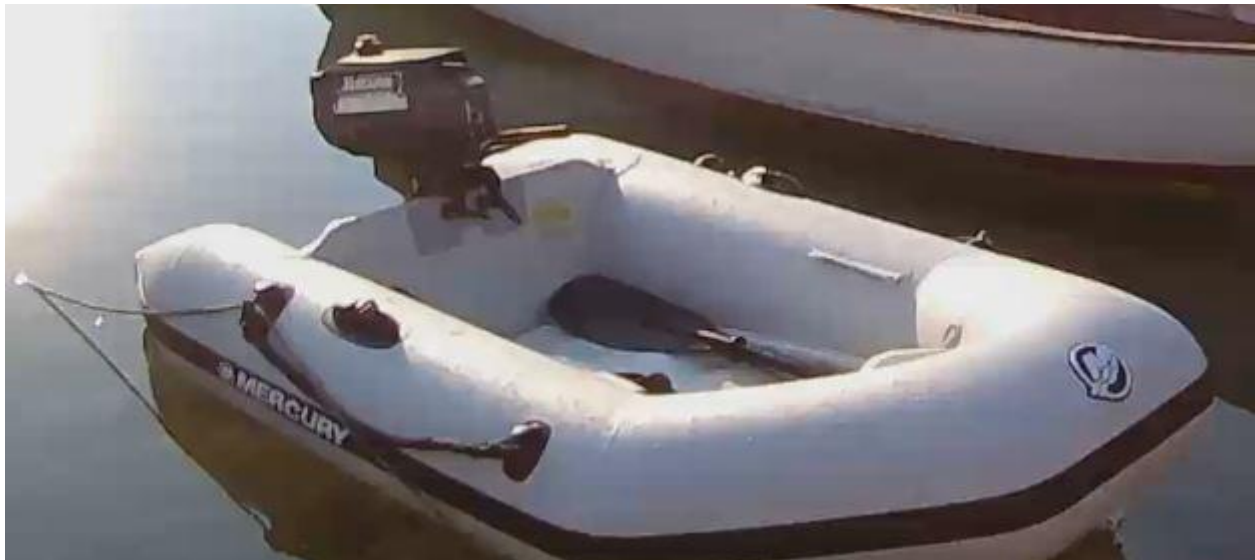
Neues Beiboot (2x verwendet) und leichter 2PS Zweitaktmotor

Jährliche Wartung durch Fachpersonal, incl. Funkgerät (2014, nicht auf Foto), GPS, Selbststeuerung, 2x Vorstag (1x Genua, 1x Selbstwendefock), Lazyjack, feste Sprayhood, Geräteträger, Davits, 2x neue Solarpanele, 2x 100A Verbraucheratterie 2014 neu, Genua und Fock jeweils neuer UV-Strip, etc., umfangreiche Stauräume, - guter Gesamtzustand