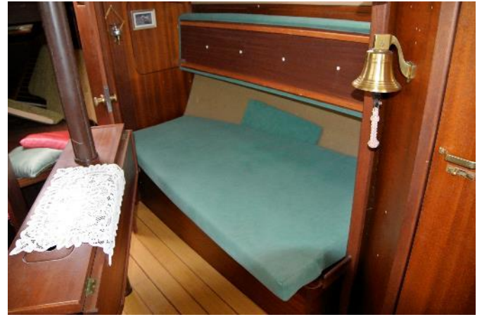
Liegefläche für Kinder